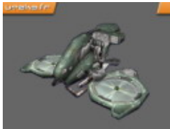
Manta - 1 place

Le Hellbender n'est pas aussi rapide que le Manta ou le Scorpion, moins maniable que le Raptor et surtout beaucoup moins puissant que le Tank. Mais sa vitesse de pointe est suffisante pour traverser les vastes cartes du mod Onslaught et sa force d'attaque (2 armes) plus que convenable. Ce qui en fait un véhicule équilibré idéal pour couvrir les troupes.