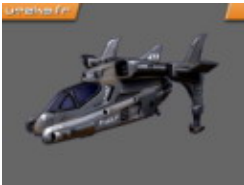
Human Space Fighter - 1 place

A l'instar du Ion Caon, ce véhicule aérien n'est pas pilotable mais vous pouvez actionner ses armes via un panneau de contrôle à terre et ainsi organiser de beaux bombardements à distance.