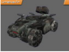
Leviathan - 5 places