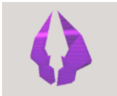
Double damage , Double les dommages provoqués par vos armes ( dure 30 secondes )