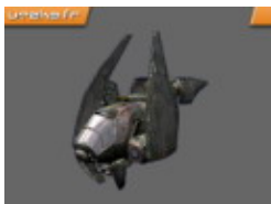
Raptor - 1 place

Buggy, véhicule rapide. En restant appuyé sur la touche tir vous pouvez charger plusieurs « orbs » connectés entre eux par un « ruban » vert. Ils viendront ensuite s'enrouler autour de votre cible (tourelles, véhicules) pour exploser. Vous pouvez également faucher les éventuels piétons à l'aide de lames rétractiles placées sur le véhicule.