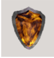
Petit Bouclier , 50 points de bouclier ( 150 max )