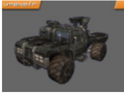
Hellbender - 3 places

Le Hellbender n'est pas aussi rapide que le Manta ou le Scorpion, moins maniable que le Raptor et surtout beaucoup moins puissant que le Tank. Mais sa vitesse de pointe est suffisante pour traverser les vastes cartes du mod Onslaught et sa force d'attaque (2 armes) plus que convenable. Ce qui en fait un véhicule équilibré idéal pour couvrir les troupes.