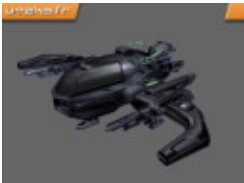
Skaarj Space Fighter - 1 place

Véhicule aérien efficace pour le sabotage et l'infiltration.