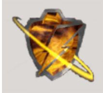
Gros bouclier , 100 points de bouclier ( 150 max )