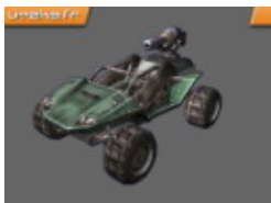
Scorpion - 1 place

Hovercraft très rapide mais peu puissant. Les touches saut et s'accroupir permettent de vous élever dans les airs ou au contraire de vous mouvoir au ras du sol. Idéal pour écraser vos ennemis ou leur trancher la tête.