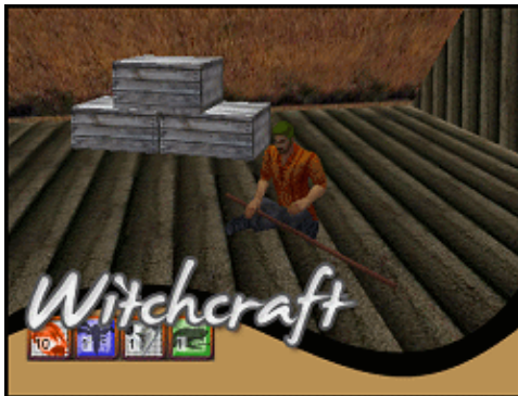
Fabricant d'objets magique